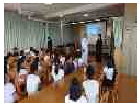
シルクプロジェクト(5月13日(月))