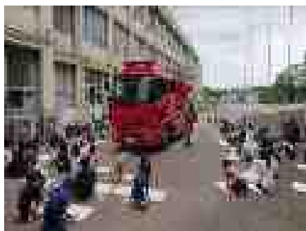
はたらく消防写生会(5月7日(火))