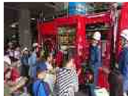
消防署見学(5月28日(火))