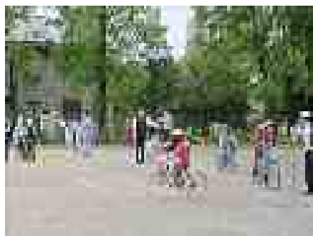
自転車安全教室(5月9日(木))