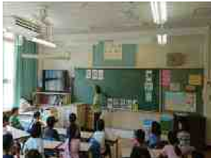
7月17日(火) 外国語活動(2年)