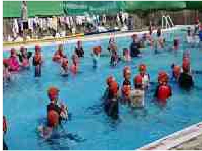
7月13日(金) 着衣泳(5・6年)