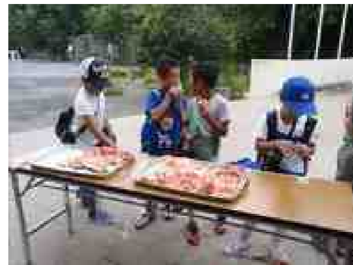
7月26日(木) 畑でとれたスイカを食べました